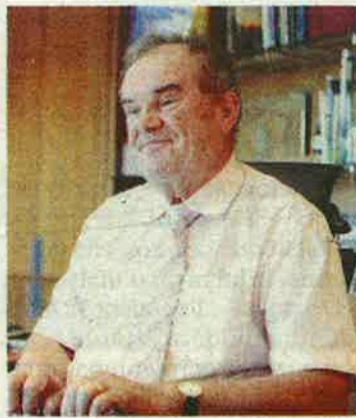
Georges Labazée.

Dans le cadre de l'accompagnement aux activités productives, le Département mobilise essentiellement l'aide à l'investissement immobilier, dispositif majeur de notre action en matière économique. Ce dispositif permet aux PME et TPE industrielles ou artisanales de pérenniser leurs activités localement. Le Fonds de croissance durable qui est dédié aux TPE est un levier intéressant pour